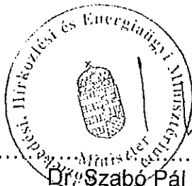
Dr. Szabó Pál közlekedési, hírközlési és energiaügyi miniszter