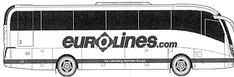
Local translation of strapline